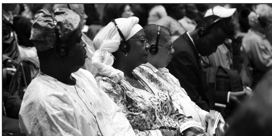
Le Congrès écoute les récits d'enseignant(e)s migrant(e)s exploité(e)s.