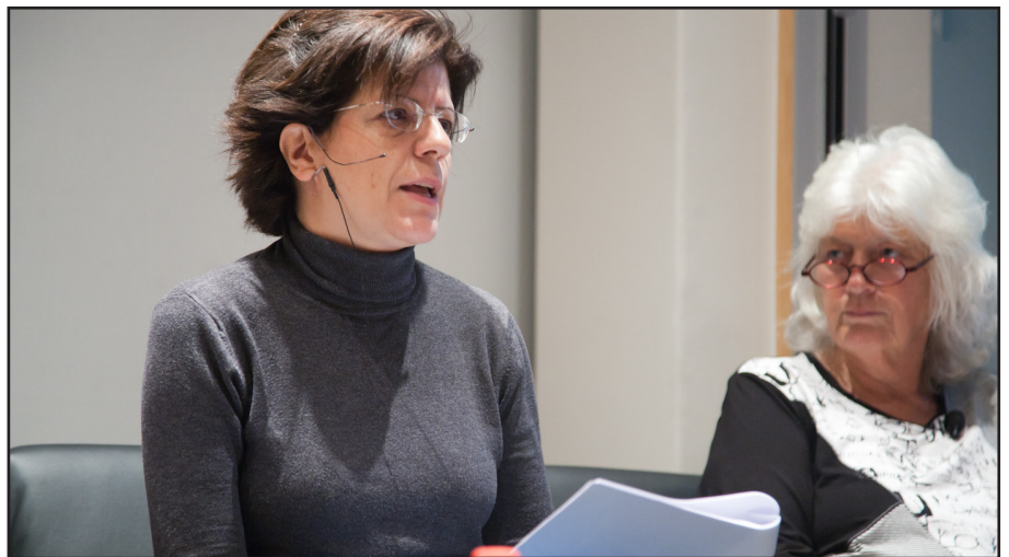
Des panellistes débattent au cours d'une séance en sous-groupe.

Dans «L'éducation, une des clés pour sortir de la crise économique?» (session 8), les orateurs/trices de l'OCDE et plusieurs syndicats ont analysé comment tous les niveaux de formation contribuent à la