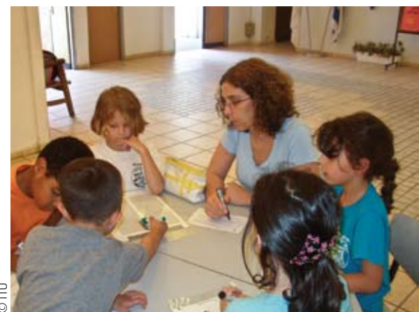
Los profesores israelíes experimentarán una mejora en su status profesional gracias a las nuevas reformas.

La primera es un centro de información, asesoramiento y orientación al que tienen acceso los trabajadores y trabajadoras de la educación. El segundo es el uso de los medios de comunicación social, incluido