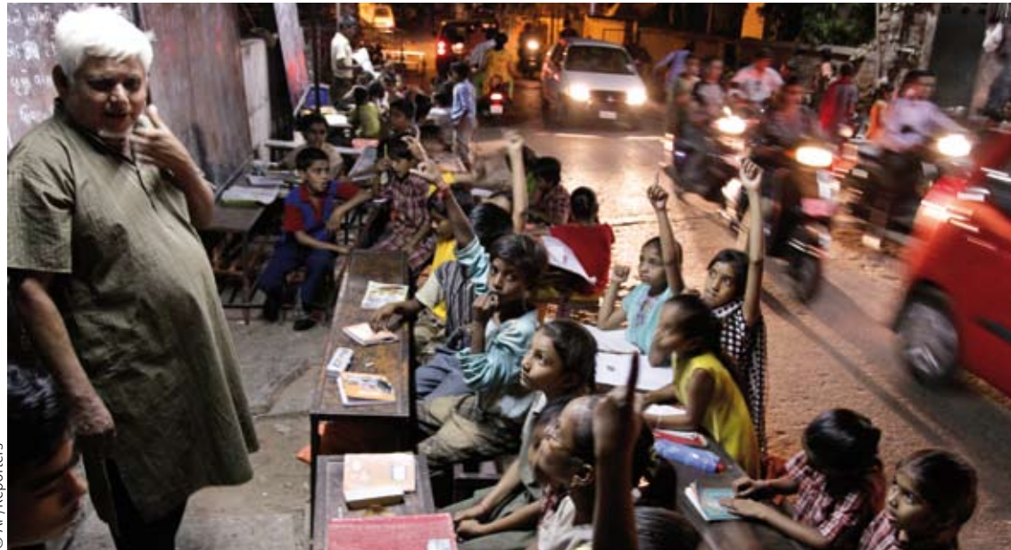
Docente enseña a los chavales en escuela al aire libre, mientras los vehículos pasan a toda prisa en Ahmadabad, India.

"En la actualidad hay más de 500.000 paradocentes trabajando en el país, lo que equi-