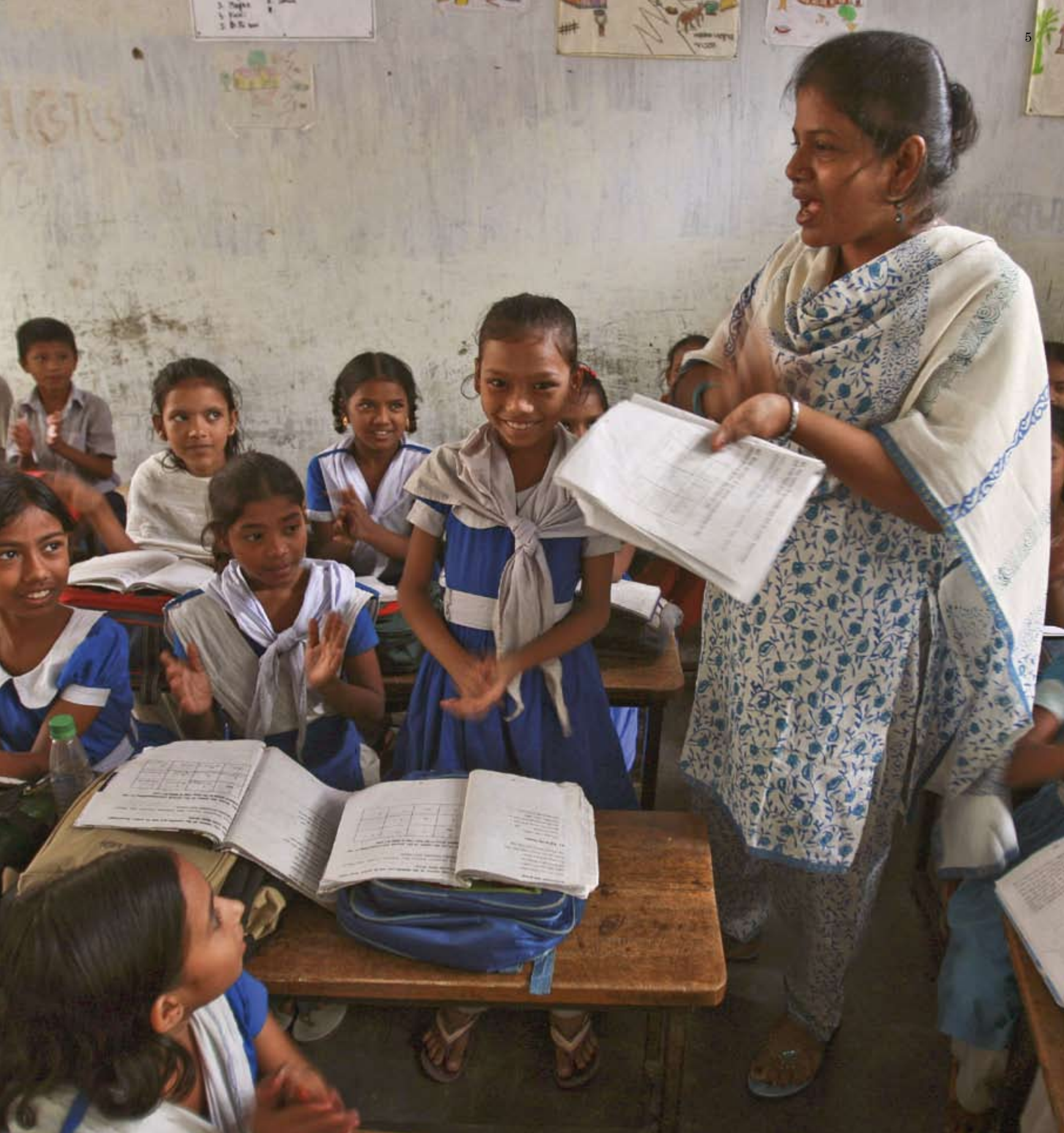
Escuela primaria pública en Dhaka, Bangladesh.