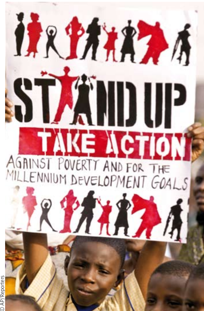
Chico sostiene cartel marcando la Jornada Mundial contra la pobreza en Lagos, Nigeria.

Según asevera Ban Ki Moon: “El mundo tiene los conocimientos y los recursos que se necesitan para alcanzar los Objetivos de Desarrollo del Milenio”. III