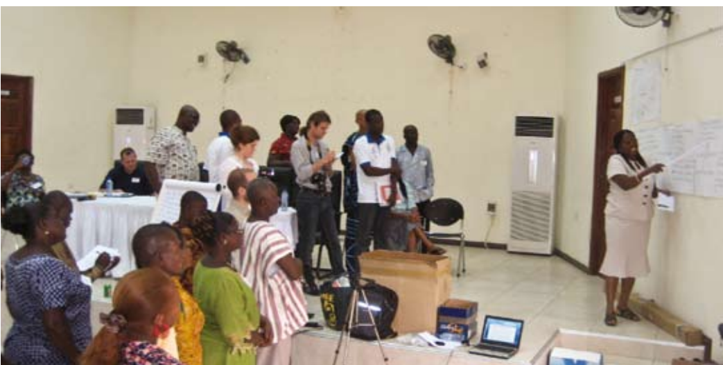
Sindicalistas y docentes comparten experiencias en Ghana.

El taller organizado en Ghana es la primera de una serie de actividades de evaluación previstas. Los siguientes talleres tendrán lugar en: Argentina, Burkina Faso, Kenya, República Dominicana, Senegal y Uganda. ■■■