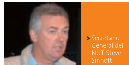
► Secretario General del NUT, Steve Sinnott

El NUT/Reino Unido está consultando a sus miembros sobre la celebración de una 'Jornada de acción por la jubilación' justo después de Pascua. El NUT está tratando de organizar una jornada de acción junto a otros sindicatos de la función pública. El NUT se encargará de coordinar la organización con otros sindicatos