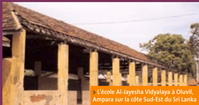
> L'école Al-Jayesha Vidyalaya à Oluvil, Ampara sur la côte Sud-Est du Sri Lanka

L'IE finance également une formation de soutien psychologique. La formation de 26 formateurs a commencé au Sri Lanka. Ce programme, qui est parrainé par le syndicat d'enseignants japonais, JTU, vise à former 200 enseignants au Sri Lanka et 500 enseignants à Aceh. Ce programme a été mis en oeuvre au Sri Lanka avec les ministères de l'Education et du Développement social ainsi que des psychiatres et psychologues locaux.