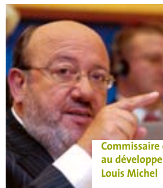
Commissaire européen au développement Louis Michel

commission élabore une "stratégie pour l'Afrique" visant à contribuer à atteindre les OMD sur ce continent et "là encore l'éducation occupera une place centrale", a assuré le commissaire.