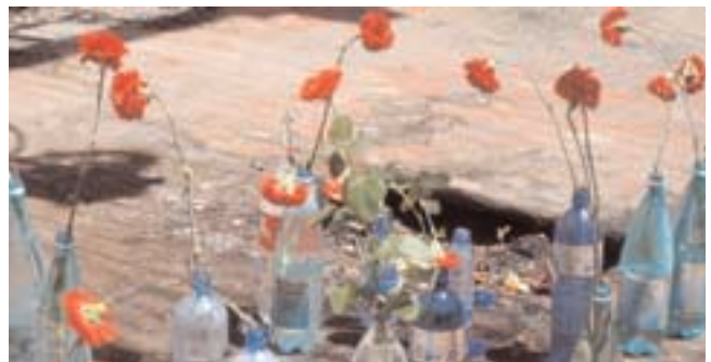
Le sol du gymnase de l'école, où 1400 personnes ont été retenues en otage, est jonché de bouteilles rappelant que les otages ont été privés d'eau par leurs ravisseurs.

La délégation de l'IE a rencontré des représentants de l'administration scolaire du district et de l'école. Une entrevue a ensuite eu lieu avec le Premier ministre d'Ossétie