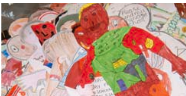
Des dizaines "d'amis" représentant les enfants privés d'éducation dans le monde ont été remis au commissaire européen au développement.

riode 2002-2007, selon les chiffres communiqués par le commissaire européen au développement et l'aide humanitaire, Louis Michel, lors d'une audition au Parlement européen organisée par l'IE et ses partenaires de la Campagne mondiale pour l'éducation.