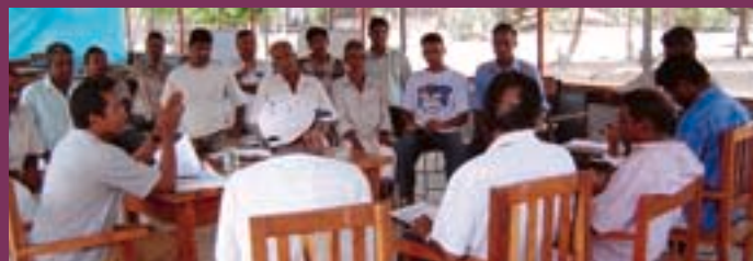
> Discussion communautaire au sujet du programme IE/NOVIB de reconstruction d'écoles au Sri Lanka

des salles informatiques, des toilettes en nombre suffisant pour filles et garçons, des laboratoires et des salles informatiques, des bibliothèques, des salles de professeurs et des cantines. Ces écoles seront construites selon des normes antisismiques.