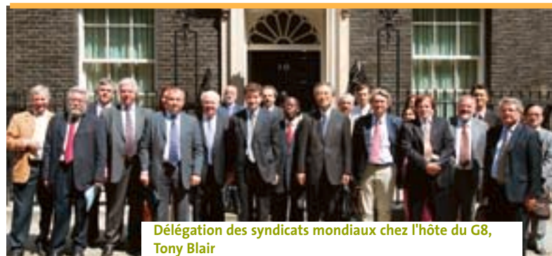
Délégation des syndicats mondiaux chez l'hôte du G8, Tony Blair

En raison du manque de flexibilité de la programmation plu-