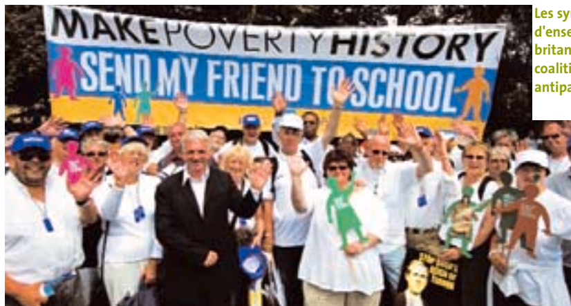
Les syndicats d'enseignants britanniques dans la coalition antipauvreté

➤ US$. 100 milliards US$ proviennent d'un engagement de l'Union européenne, qui a promis de doubler l'aide extérieure d'ici 2015. 55 milliards US$ proviennent d'un avis des ministres des Finances du G7 qui ont proposé d'annuler la dette pour les pays pauvres très endettés (PPTÉ) redevables au FMI et à la Banque mondiale, ainsi qu'au Fonds africain de développement. 17 milliards US$ sont issus d'un accord distinct du Club de Paris relatif à la dette nigérienne. Les USA et le Japon ont annoncé qu'ils doubleraient leur aide pour l'Afrique, sous des conditions différentes, et la Russie accordera un allègement de la dette des PPTÉ sur les emprunts non-APD (aide publique au développement).