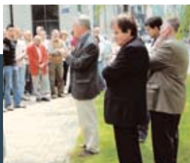
Des représentants de l'IE, de la CISL, de la CES et du CSEE montrent leur solidarité avec les victimes des explosions à Londres.

Au nom de ses 29 millions de membres, l'IE a exprimé ses condoléances aux proches de ceux qui ont été tués et à ses membres au Royaume-Uni.