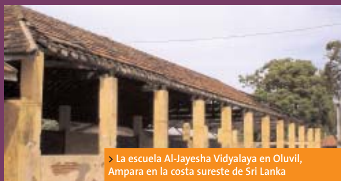
> La escuela Al-Jayesha Vidyalaya en Oluvil, Ampara en la costa sureste de Sri Lanka

La IE también apoya la formación sobre orientación en caso de trauma. Veintiséis docentes de Sri Lanka se han convertido en "formadores". El programa está patrocinado por el Sindicato de Profesores de Japón y tiene como objetivo ayudar a 200 profesores en Sri Lanka y a 500 profesores en Aceh. Este programa se realiza con la plena cooperación de los Ministerios de Educación y Asistencia Social conjuntamente con psiquiatras y psicólogos locales.