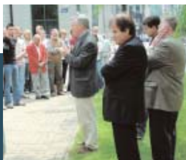
El personal de la IE, la CIOSL, el CES y el CSEE mostraron su solidaridad con las víctimas de los atentados.

En nombre de sus 29 millones de miembros, la IE expresó su sentido pésame a los familiares de los fallecidos así como a sus afiliadas en el Reino Unido.