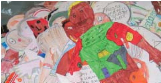
Decenas de "amigos/as" fueron entregadas al Comisario europeo para el Desarrollo en símbolo de los niños y niñas carentes de educación en el mundo.

Louis Michel reconoció que la ayuda europea representa a la vez mucho y poco. Poco, puesto que "no hay alternativa a la educación para erradicar la pobreza: