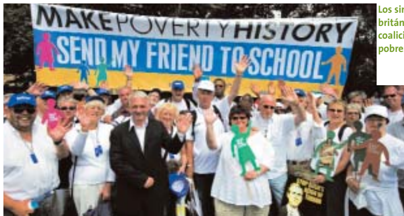
Los sindicatos británicos en la coalición contra la pobreza

➤ para 2015. Otros 55,000 millones USD corresponden a la declaración de los ministros de Finanzas del G7 que propone cancelar la deuda de los países pobres altamente endeudados (PPAE) ante el FMI y el Banco Mundial, así como el Fondo de Desarrollo en África. Otros 17,000 millones USD provienen de un acuerdo específico del Club de París sobre la deuda nigeriana. Estados Unidos y Japón anunciaron que doblarán su ayuda a África bajo condiciones diferentes, y Rusia proporcionará a los PPAE el alivio de la deuda sobre préstamos fuera de la ayuda pública al desarrollo.