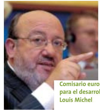
Comisario europeo para el desarrollo, Louis Michel

La Unión Europea se ha comprometido a aumentar su ayuda pública para el desarrollo del 0,36% del PIB actual al 0,56% en 2010 y al 0,7% en 2015. Esto resultará en la cantidad adicional de 20 millones de euros al año, y según destacó el Comisario, "gran parte de esta ayuda obviamente beneficiará a la educación". Al mismo tiempo, la Comisión elabora una estrategia para África con el fin de con-