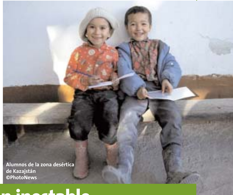
Alumnos de la zona desértica de Kazajstán