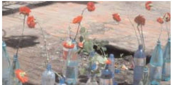
El suelo del gimnasio de la escuela, donde retuvieron a 1400 personas, está cubierto de botellas para recordar que los rehenes estuvieron privados de agua.

La delegación de la IE se reunió con representantes de la administración escolar del distrito y de la escuela. Se procedió enseguida a una entrevista con el primer ministro de Osetia del Norte y con el presidente de la Comisión constituida para organizar la distribución de la ayuda a las