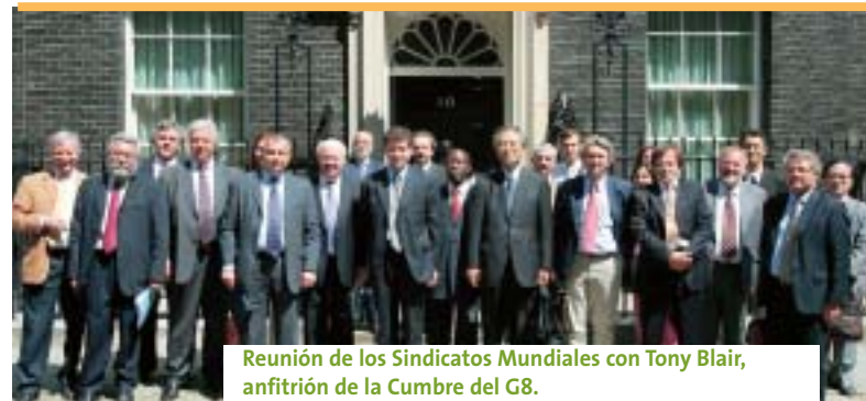
Reunión de los Sindicatos Mundiales con Tony Blair, anfitrión de la Cumbre del G8.

tribuir a la consecución de los ODM en este continente donde "la educación ocupará todavía un lugar central", aseguró el Comisario.