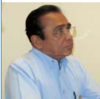
➤ Esta huelga va más allá de los salarios, explica el coordinador regional principal de la IE, Aloysius Mathews.

L a asociación de docentes de Tonga (FITA), afiliada a la IE, está a la cabeza de una larga huelga de funcionarios en esta isla del Pacífico. Los 3.000 funcionarios de Tonga —de los cuales 1.400 son docentes— fueron a la huelga después de que a los altos funcionarios del gobierno se les otorgaran aumentos salariales de hasta el 80%, mientras que los funcionarios peor pagados, que ganan sólo 47 dólares a la semana, recibieron un aumento del 1%.