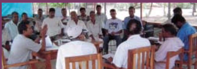
> Debate comunitario sobre el programa IE/NOVIB de reconstrucción de escuelas en Sri Lanka

La IE y NOVIB firmaron el 25 de junio un Memorando de Entendimiento con los responsables de cuatro gobiernos de