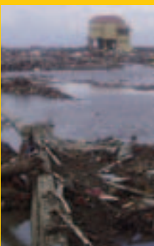
>>> Aceh après le Tsunami en décembre 2004

L'un des exemples les plus marquants est la création du Fonds de solidarité Tsunami pour la reconstruction et la remise en état du système éducatif à Aceh et au Sri Lanka, les régions qui ont été les plus touchées par le tsunami en 2004.