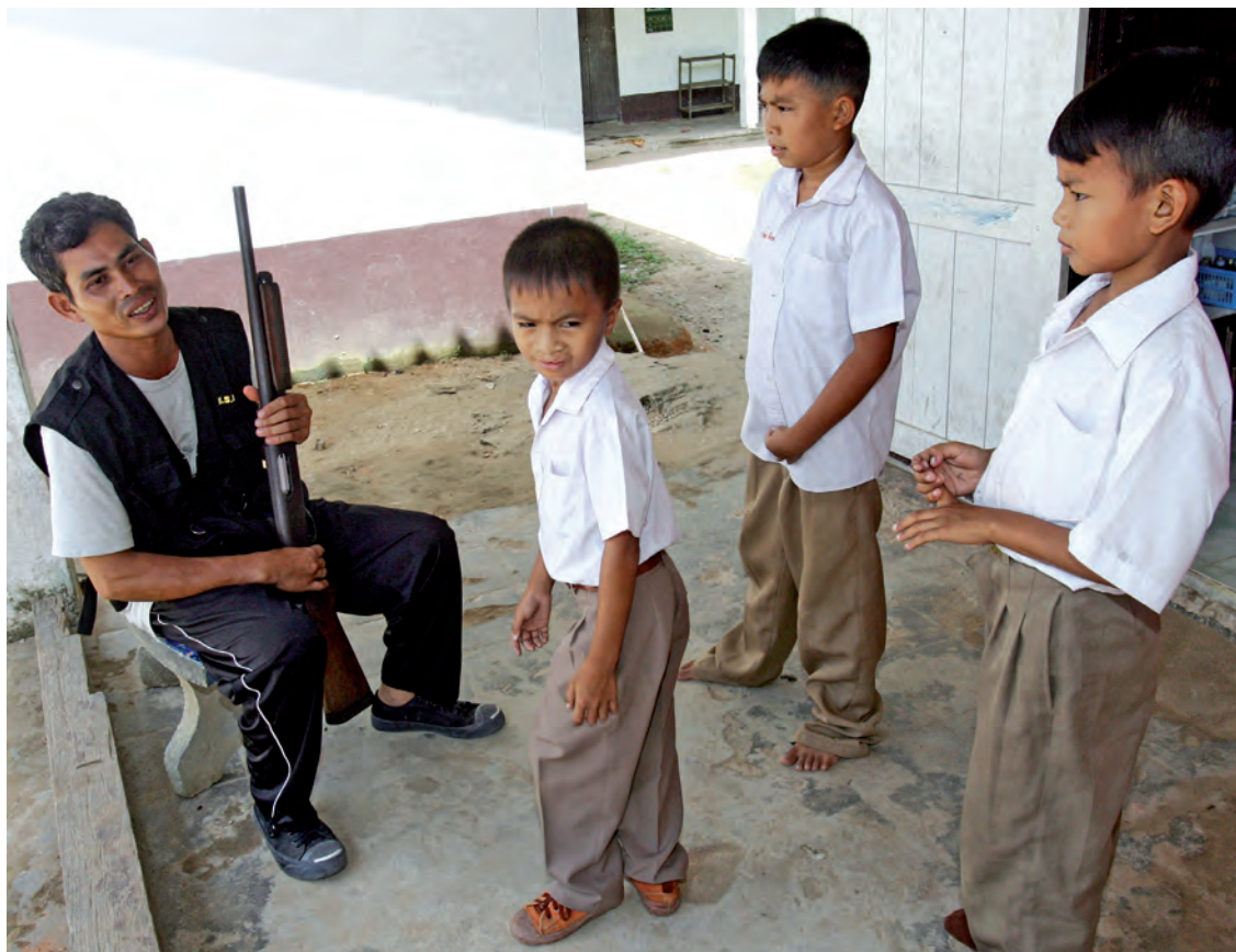
Algunos alumnos de primaria de Tailandia (arriba) y de Irak (izquierda) están protegidos por guardias armadas

adecuada para que los niños y niñas puedan seguir ejerciendo su derecho a la educación en un entorno seguro.