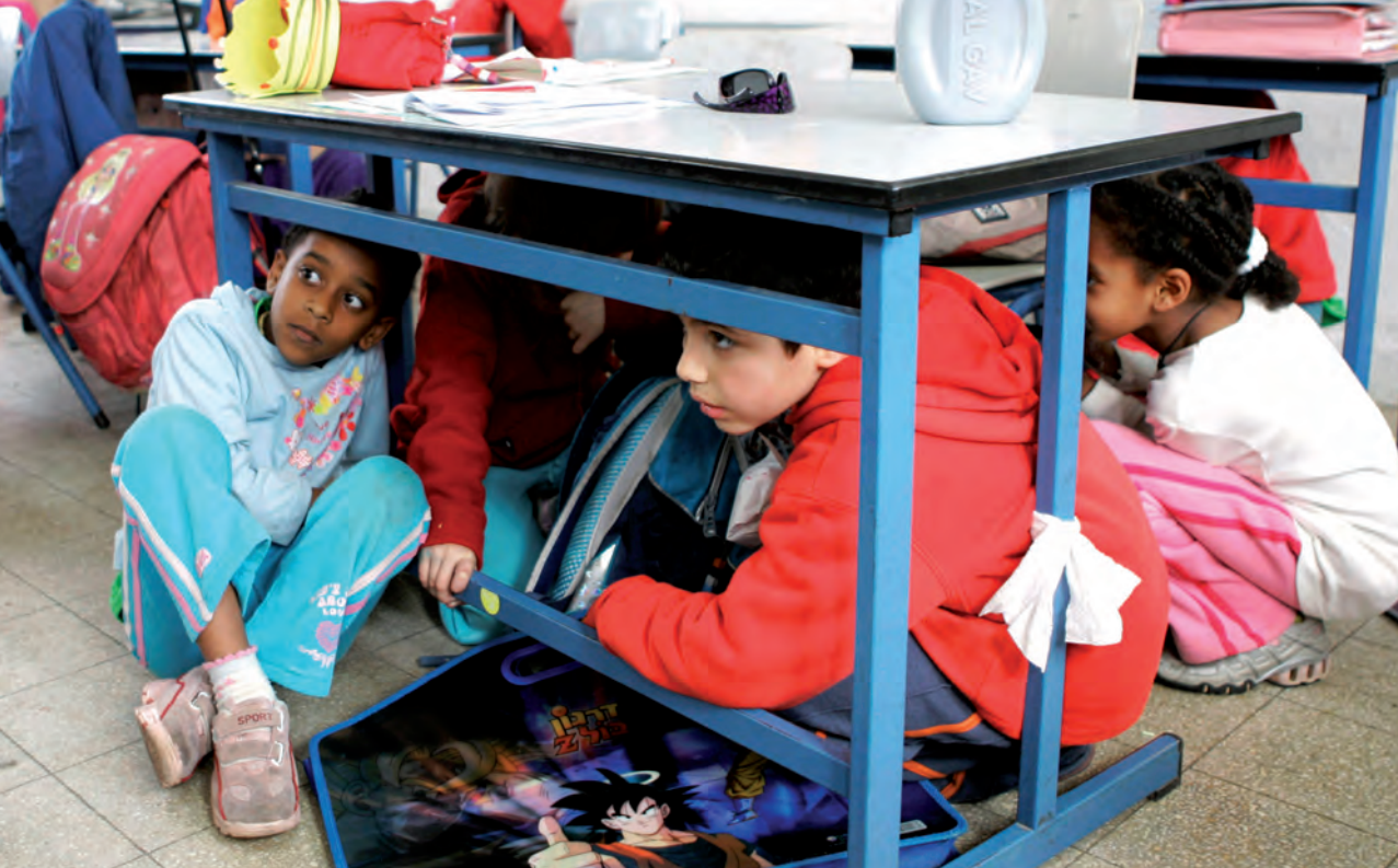
Los alumnos de primer grado de Israel practican un simulacro de emergencia en caso de ataques con cohetes

colección de información con vistas a contribuir al control internacional y el análisis de la frecuencia, el alcance y la naturaleza de los ataques militares y políticos a los estudiantes, docentes, personal académico y otro personal de la educación, así como a las instituciones educativas, y supervisar los esfuerzos para acabar con la impunidad de todos estos ataques. La comunidad internacional insta al Consejo de Seguridad de las Naciones Unidas a que apoye estos esfuerzos e incite acciones futuras para prevenir los ataques contra la educación.