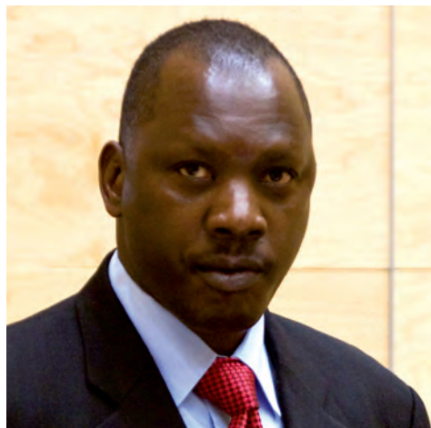
Thomas Lubanga, en el primer juicio la Corte Penal Internacional, está acusado de reclutar y utilizar niños soldados en la RD del Congo, hechos que él niega

La disuasión de los actos de violencia armada en contra de la educación requiere un esfuerzo mucho más concertado para poner fin a la impunidad