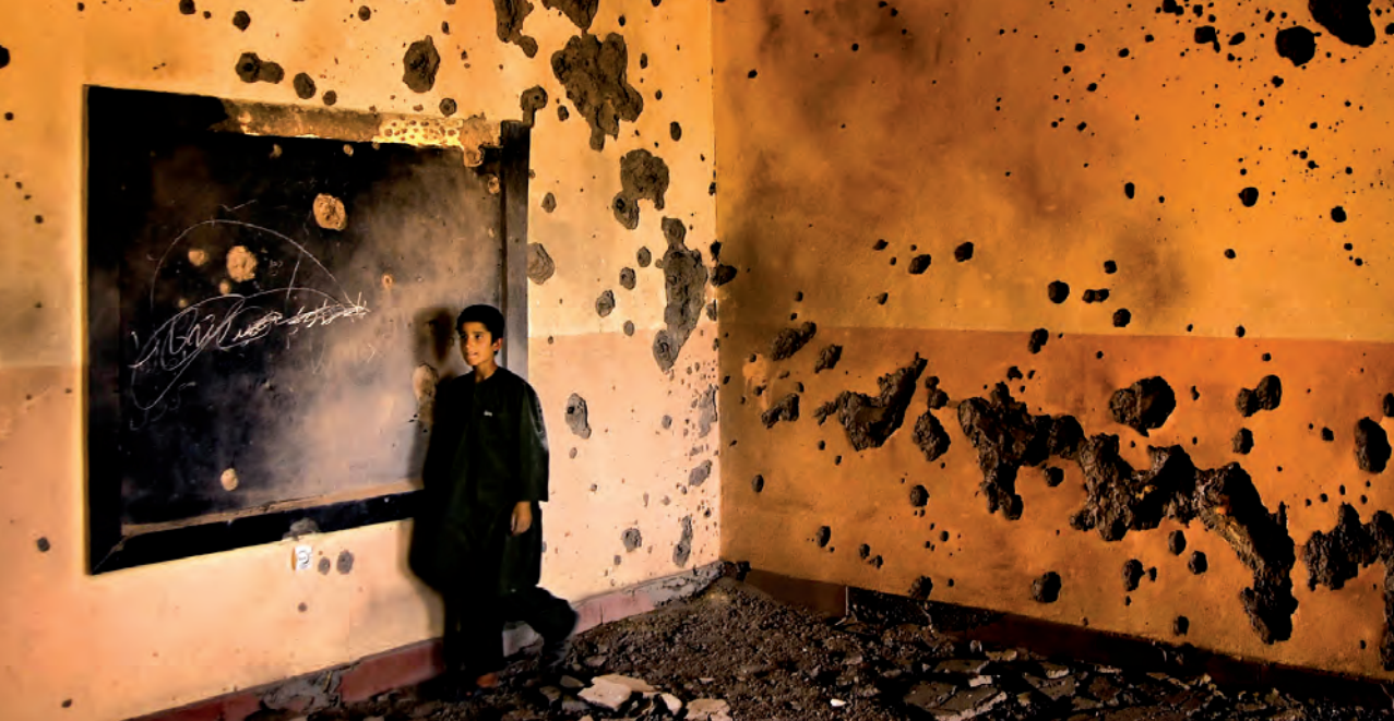
La infraestructura educativa en Afganistan (arriba) ha sido destruída y las escuelas deben recurrir a tiendas

universal es el más asequible de todos los ODM.