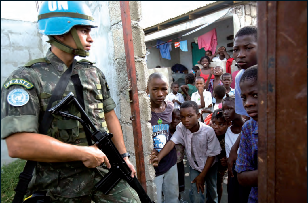
Un miembro de la fuerza de paz monta guardia fuera de una escuela en Cité-Soleil, Haití